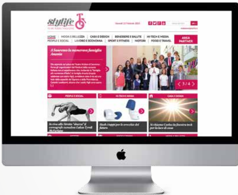
Home page Stylife

Diventa anche tu Partner di Stylife.it, un'area dedicata in cui inserire la tua azienda con logo, descrizione, gallery, indirizzo, contatti, social, google map. Stylife è accessibile anche da smartphome e tablet.